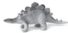
لا تمثل أحفورة

(5) أَثْنَاءَ رِحْلَةِ لَيْلَى وَشَقِيقِهَا أَحْمَدَ إِلَى إِحْدَى الْغَايَاتِ عَثَرَ عَلَى أَحْفُورَةٍ لِصَدْفِيَّةٍ، وَاحْتَلَفَا فِي تَفْسِيرِ وُجُودِ الْأَحْفُورَةِ؛ أَبَدَتْ لَيْلَى رَأْيَهَا فِي أَنَّ الْعَابَةَ كَانَتْ صَحْرَاءً، بَيْنَمَا كَانَ رَأْيُ أَحْمَدَ أَنَّهَا كَانَتْ بُحَيْرَةً.